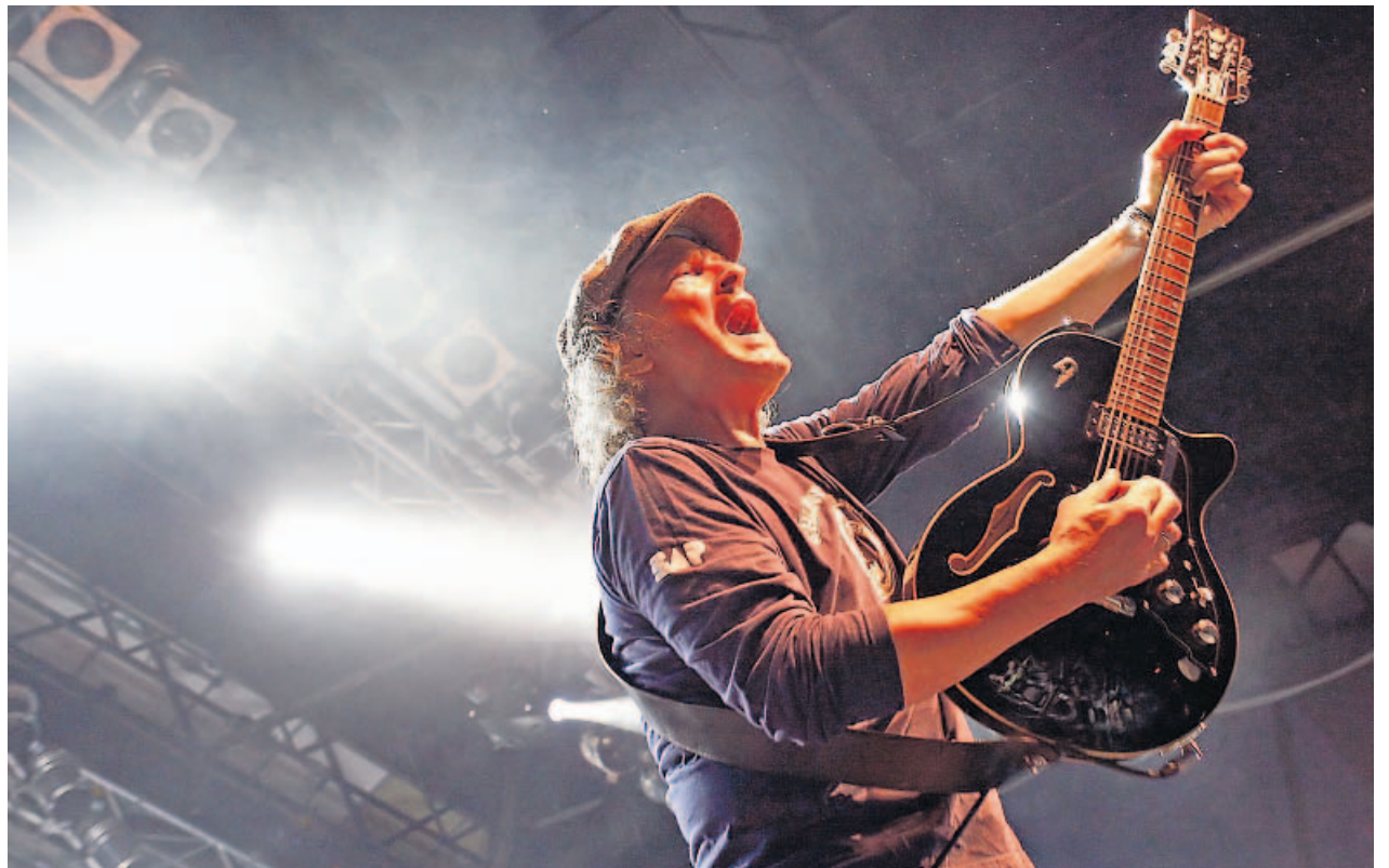
BAP-Chef Wolfgang Niedecken sorgte für einen Höhepunkt beim Festival „Lieder am See“.

Wer eine Fahrkarte ergattern kann, lüftet bei einer Bootsrundfahrt die Ohren, während die Bühne fürs Finale umgebaut wird und sich am Firmament der ersten Sterne blicken lassen.